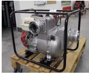
Schmutzwasserpumpe Fördermenge 1.650 L/Min.