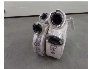
Druckschläuche B und C

Auf Grund der Hochwasser- und Sturmereignisse im letzten Jahr mussten wir einige Neuanschaffungen tätigen.